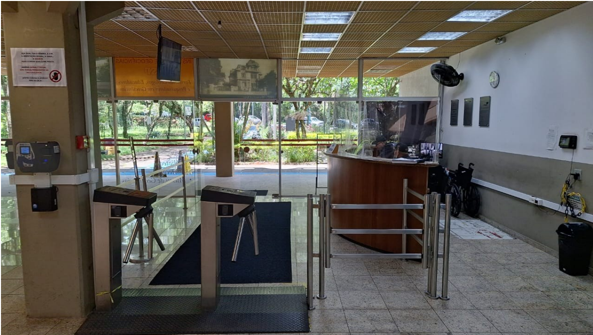
Figura 1 - Portaria do atual do IGc.(A empresa CONTRATADA deverá desmontar as catracas atuais e entregar para a guarda da CONTRATANTE).