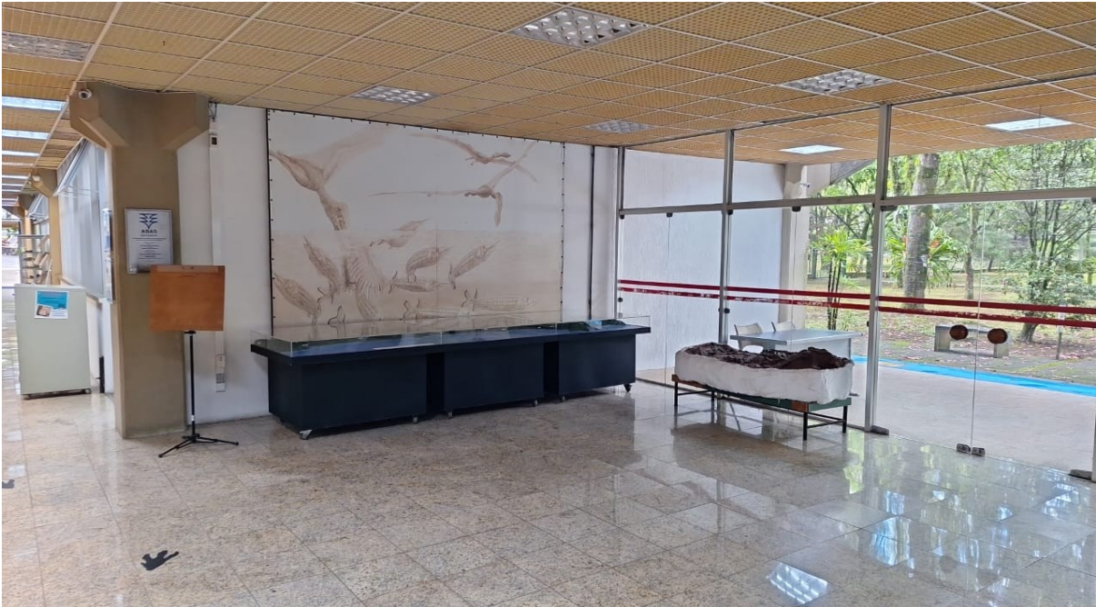
Figura 3 - Novo local de instalação

A empresa CONTRATADA deverá instalar as catracas na posição da figura acima, cortando o piso com máquina apropriada e instalação de chapa de inox ou alumínio para acabamento plano ao piso. A CONTRATANTE fica responsável pelo fornecimento dos pontos de rede ativados.