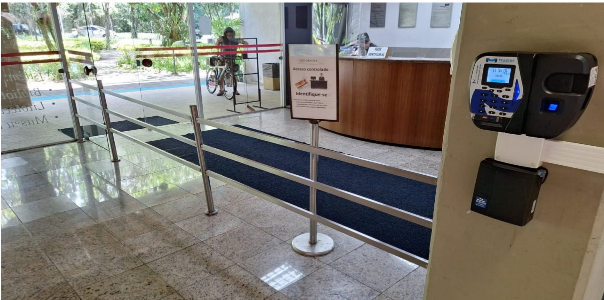
Figura 2 - Detalhe da lateral da portaria. O cercado deverá ser reposicionado pela CONTRATADA conforme figura 4.